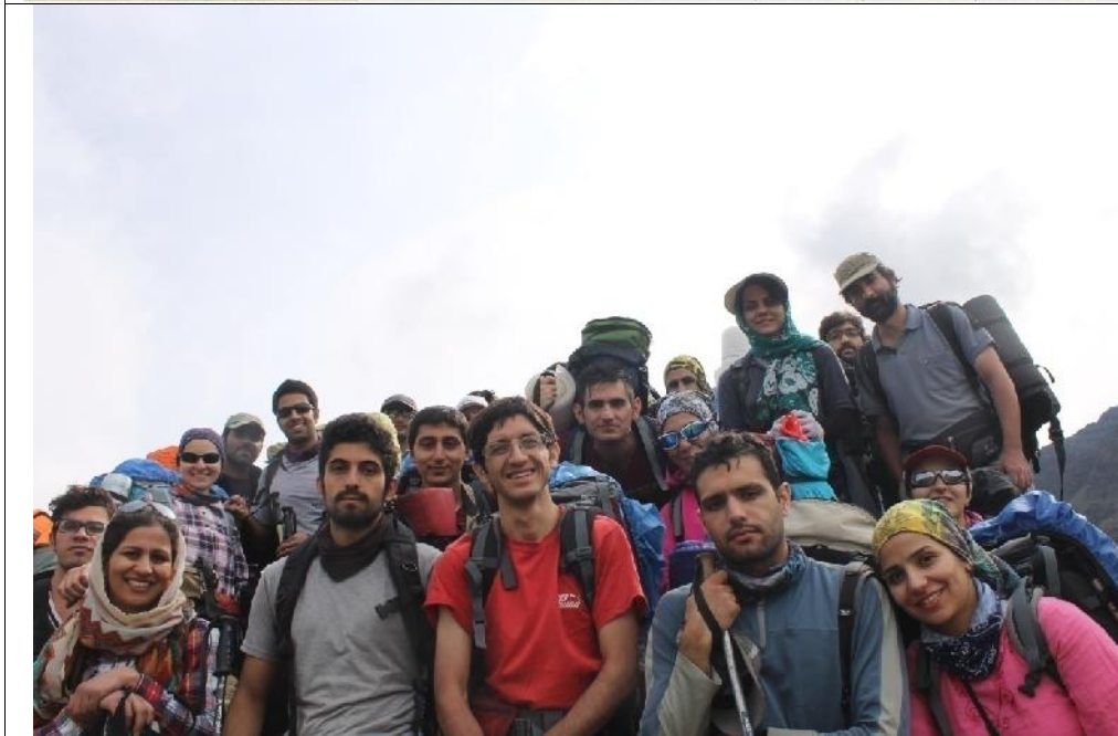
عکس های برنامه: